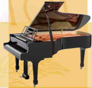
Mod. 218 - Concert I