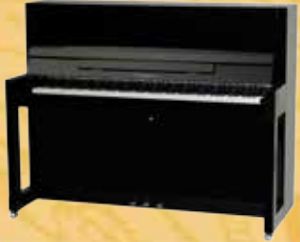
Mod. 115 - Premiere