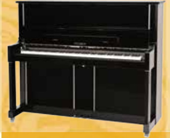
Mod. 125 - Design