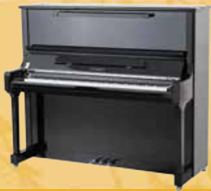
Mod. 133 - Concert