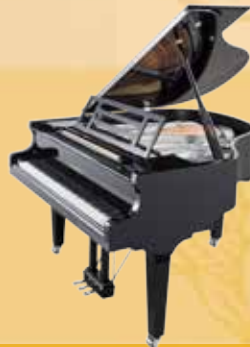
Mod. 162 - Dynamic I