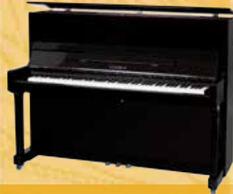
Mod. 122 - Universal