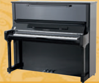
Mod. 133 - Concert