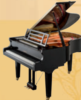
Mod. 179 - Dynamic II