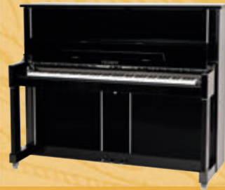
Mod. 125 - Design